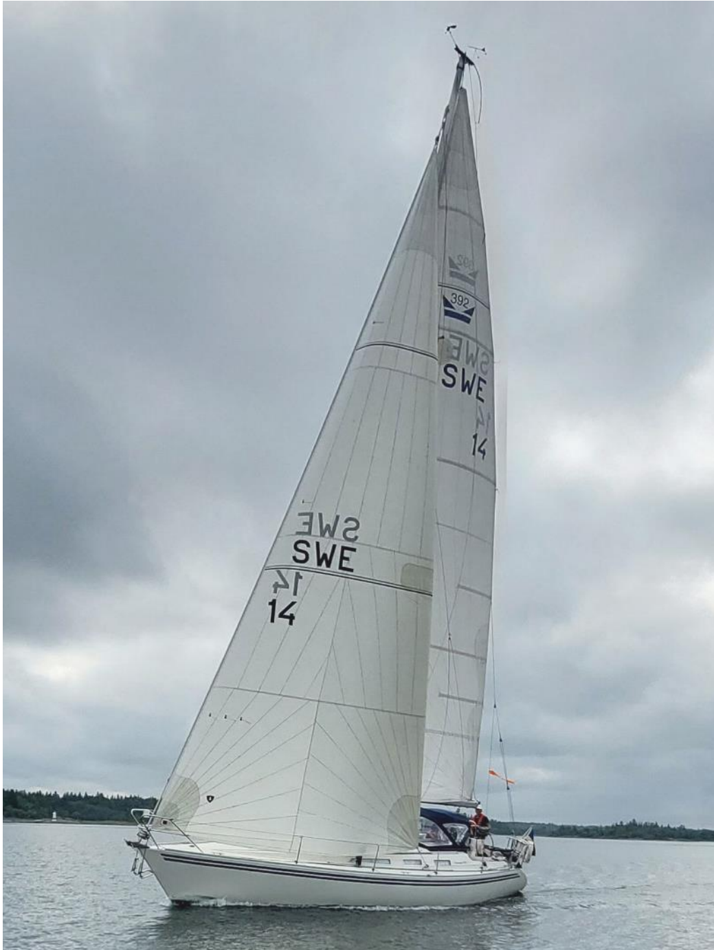
Figur 3 Höstens vinnare Ulf Lundahl passerar oss i god fart, trots svag vind.