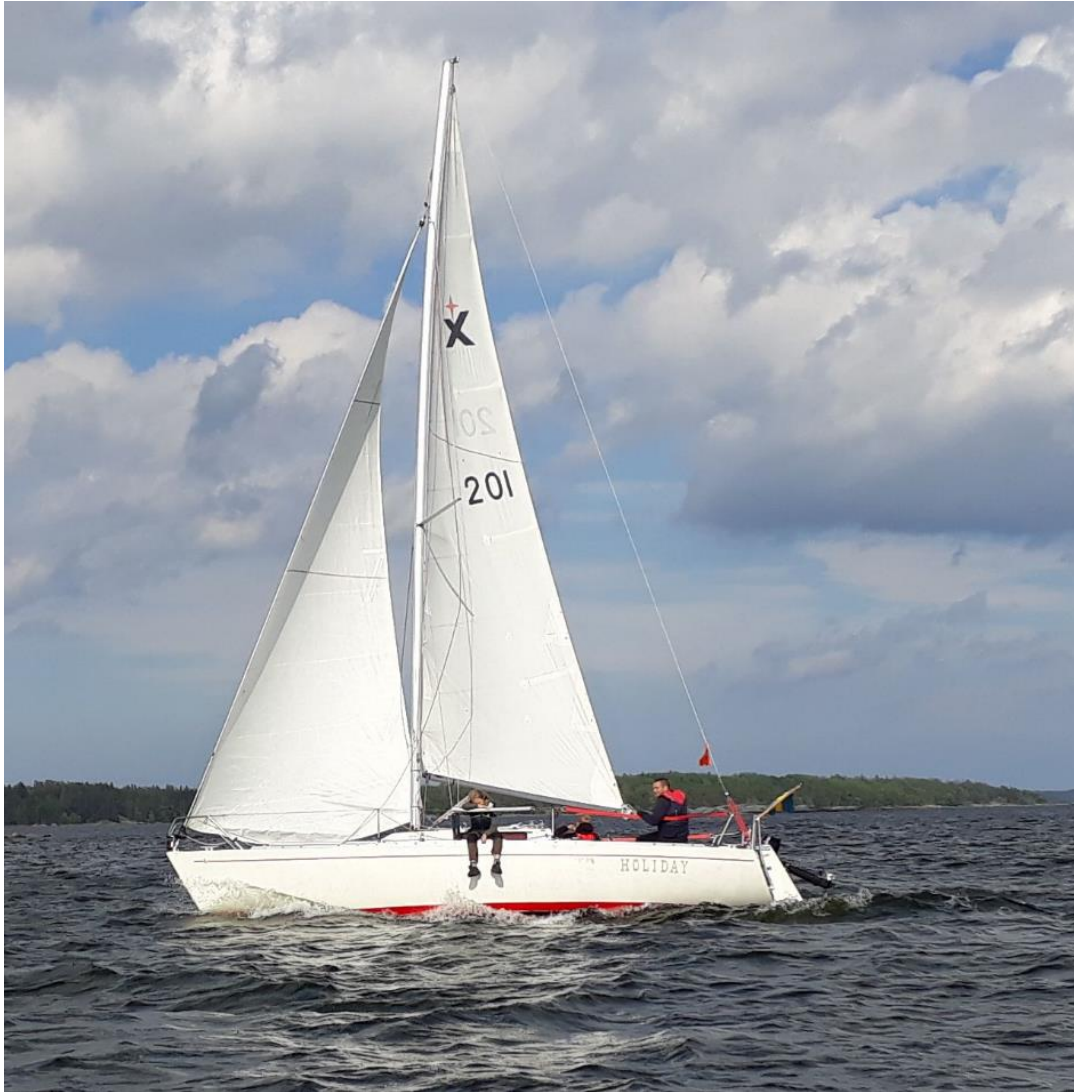
Figur 2 En av årets nya deltagare på väg mot mål